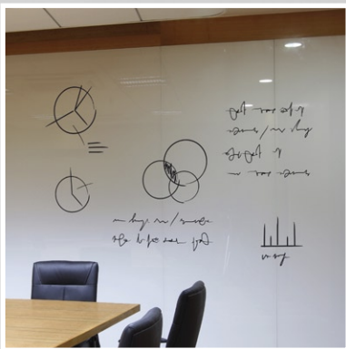
Mampara y pizarra